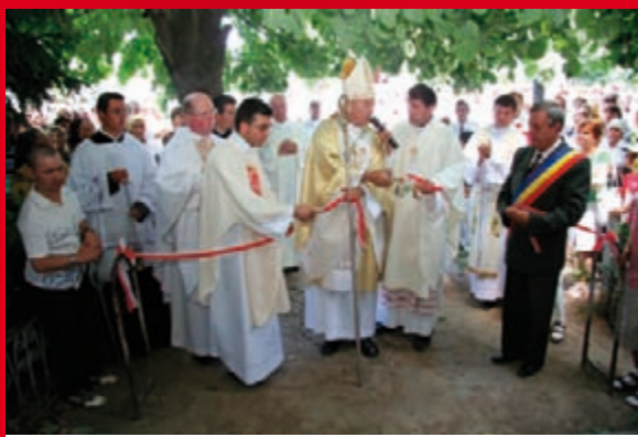
Deschiderea oficială a Centrului de Îngrijire la Domiciliu Oțeleni

În cadrul proiectului „PENTRU SENIORII NOȘTRI – Rețea de ONG-uri furnizoare de servicii sociale pentru persoanele vârstnice” dezvoltat de către Fundația Principesa Margareta a României, Centrul Diecezan Caritas Iași a fost desemnat model de bună practică pentru serviciile de îngrijiri la domiciliu adresate persoanelor vârstnice, beneficiind, în luna iunie 2009, de vizita reprezentanților ai 10 ONG-uri din țară care sunt implicate în activități sociale adresate vârstnicilor. De asemenea a fost organizat și un seminar regional la Iași la care au participat reprezentanți ai autorităților locale și ai ONG-urilor care oferă servicii sociale persoanelor vârstnice din regiunea Moldovei.