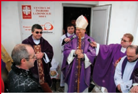
Deschiderea oficială a Centrului de Îngrijire la Domiciliu Siret