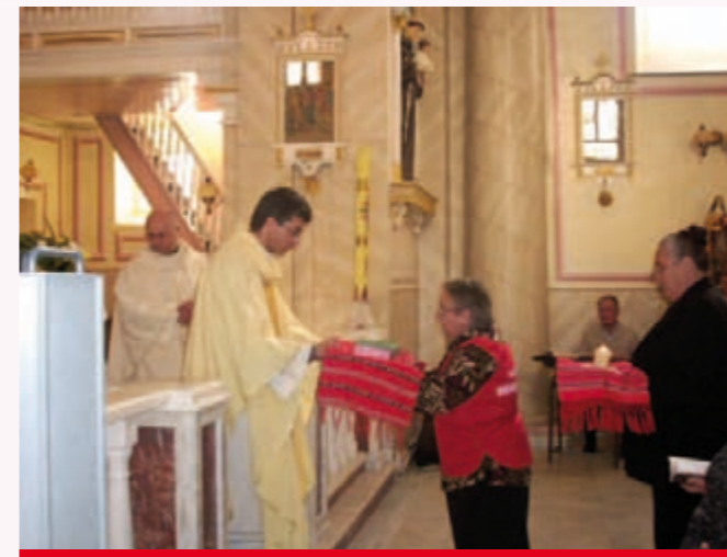
Ziua Mondială a Vârstnicului Bacău

Maria a Divinei Providențe" (Opera "Don Alois Guanella") Iași, Congregația Fiicelor Sf. Francisc de Assisi, Direcția de Asistență Comunitară Iași, Fundația Solidaritate și Speranță.