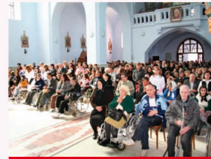
Ziua Mondială a Bolnavului 13 mai 2009, Cacica