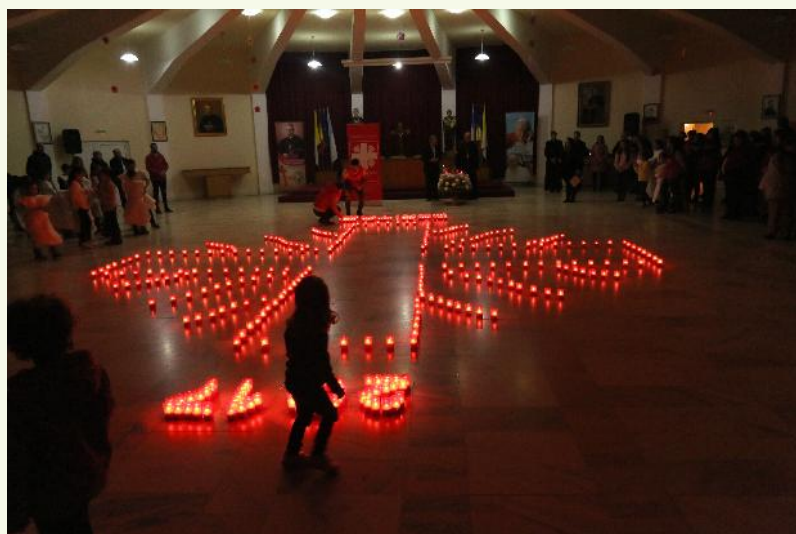
Centrul Diecezan Caritas Iași