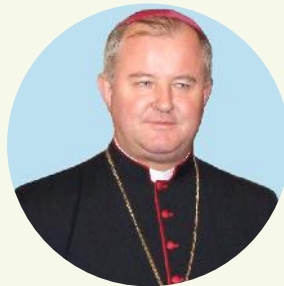
PS Aurel Percă Episcop auxiliar de Iași

Raportul anual pe care Centrul Caritas Diecezan Iași îl prezintă în această broșură nu vrea să fie o ocazie pentru a exalta această instituție bisericească, nici pentru a demonstra eficiența organizării sale, chiar dacă este oportun să recunoaștem angajarea plină de dăruire a tuturor operatorilor care activează în cadrul ei.