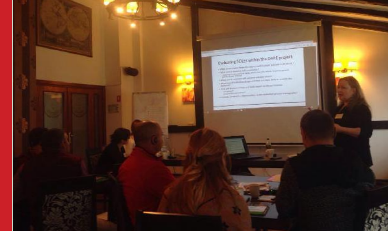
Raport anual 2017