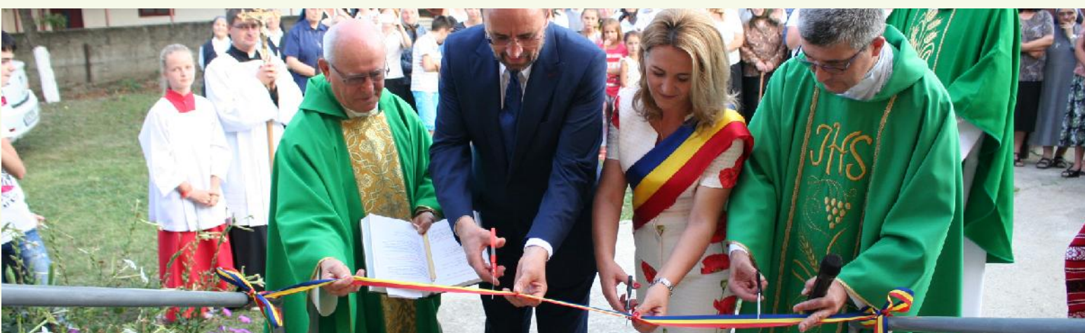
Centrul Diecezan Caritas Iași

În anul 2017 rețeaua Programul „Servicii de Îngrijire la Domiciliu” a fost extinsă cu două Centre de Îngrijire la Domiciliu: CID Faraoni, jud Bacău și CID Oțeleni, jud Iași. Cele două inițiative reprezintă un model de parteneriat public privat, finanțarea necesară pentru salariile personalului, spațiile pentru desfășurarea activității și cheltuielile administrative fiind susținute de consiliile locale. În fiecare centru se oferă servicii pentru 40 de vârstnici din comunitate.